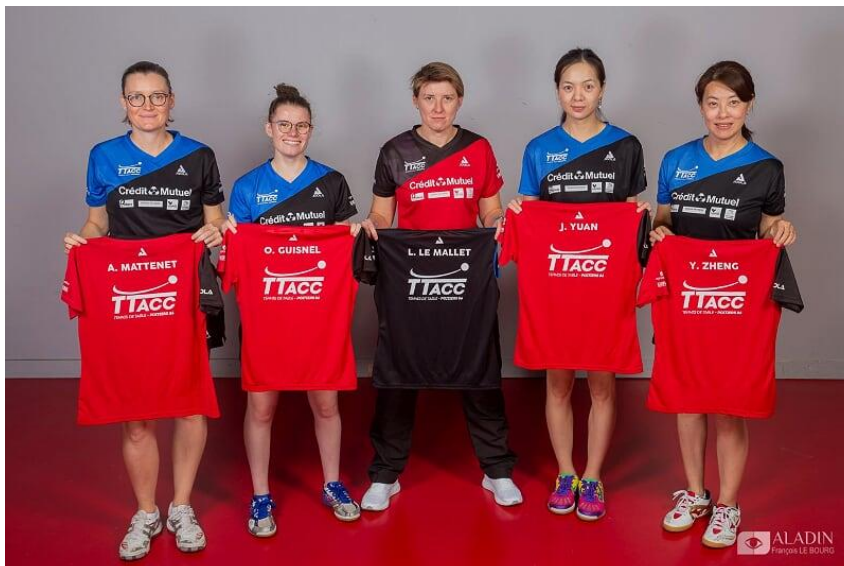
L'équipe 1 Dames de PRO A, 2021/2022

Le club compte 2 équipes féminines et 7 équipes masculines.