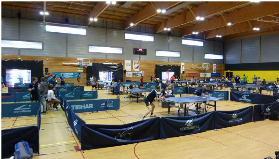
Une vue de la salle principale